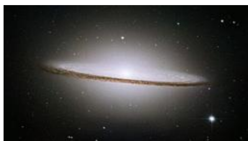
おとめ座にあるソムブレロ銀河のハッブル望遠鏡による写真